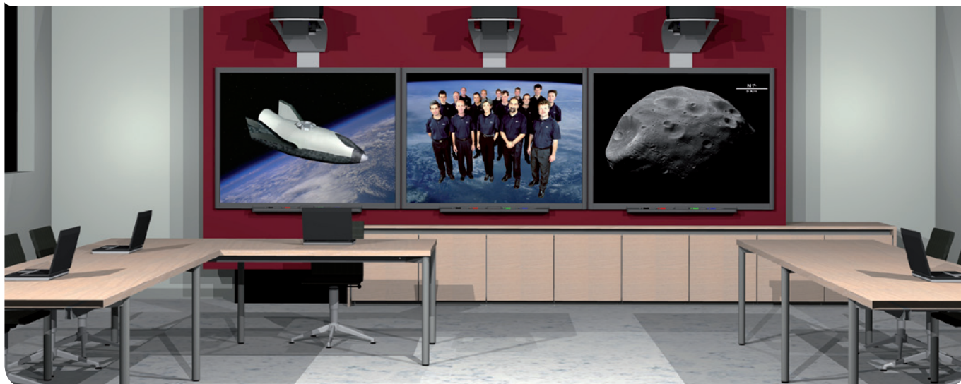
Am Sitz von Vanerum in Bochum nutzen 12 Mitarbeiter heute die Vorteile des Dokumenten-Management-Systems von Canon.